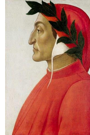
Sandro Botticelli Ritratto di Dante - 1495 (Ginevra, collezione privata)

Dante Alighieri (Paradiso, Canto V, 41-42)