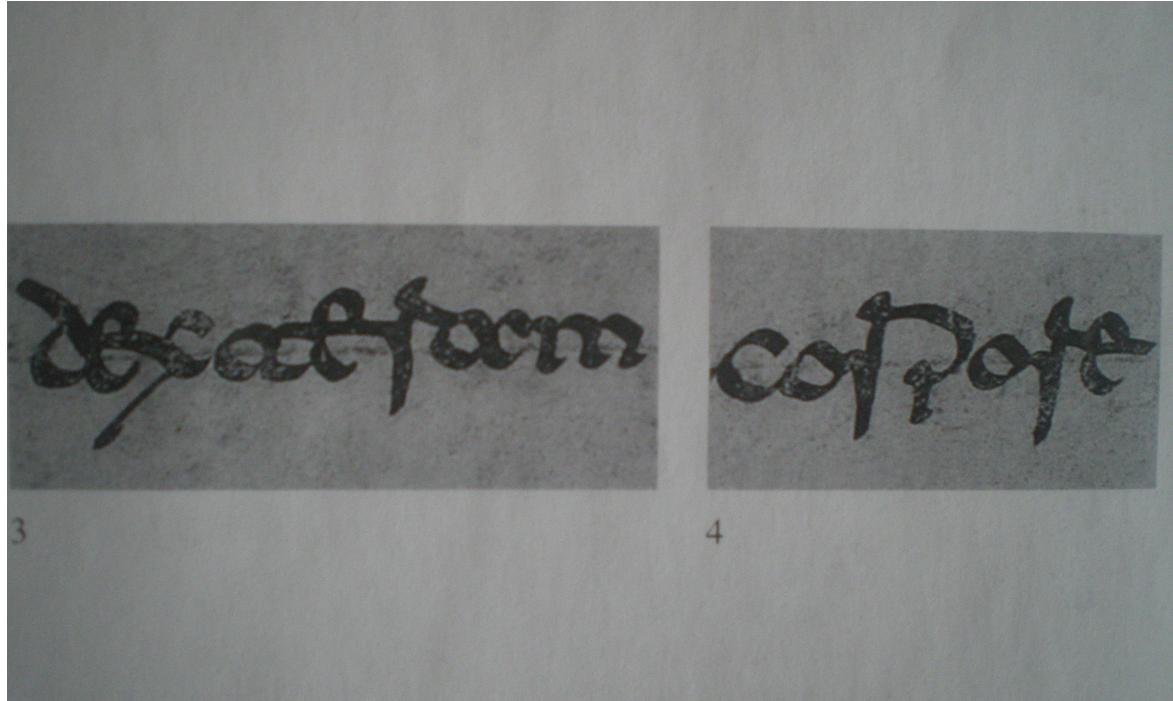
Tav. 142. Tratti orizzontali di collegamento