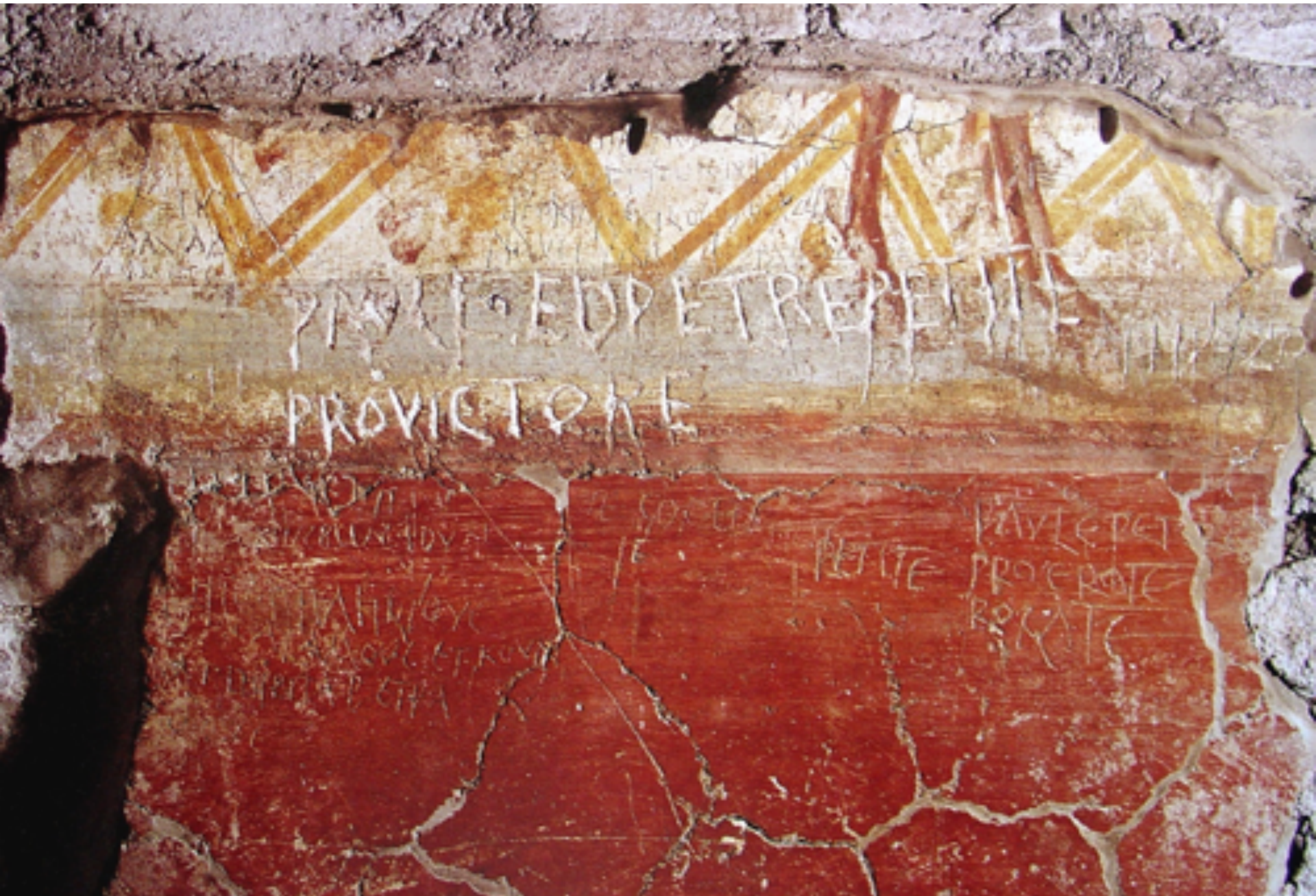
Tav. 118. Graffiti di S. Sebastiano