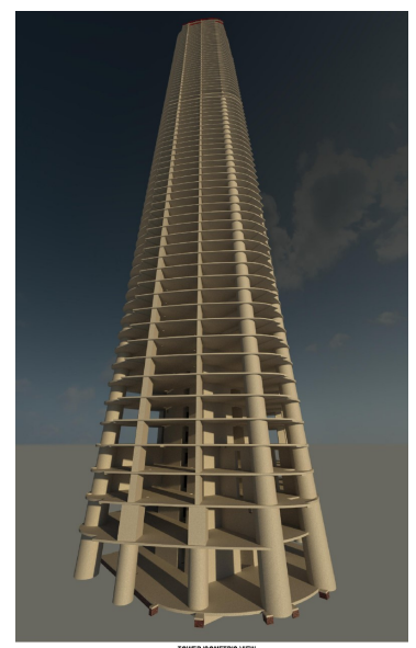
300 George Street Tower, Brisbane, 2021