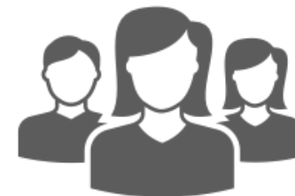
Collaboratori Tirocinanti e volontari