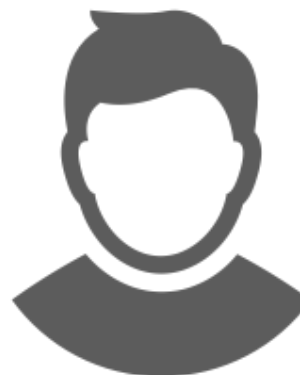
Tutor xxx xxxx