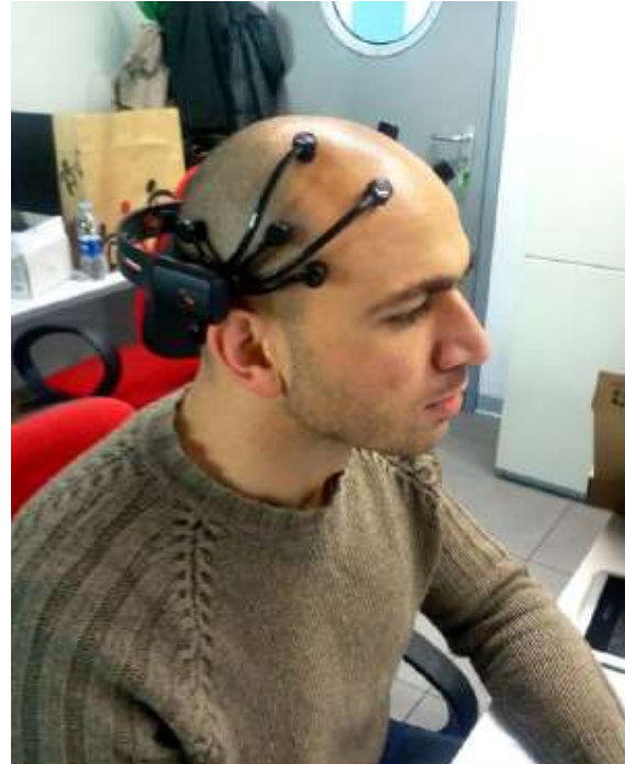
IMA, estensione di ISA per chi ha disabilità motorie

Progetto di Informatici Senza Frontiere, Università degli Studi di Bari e LEO Lions che porta Strillone a diventare la prima App per non vedenti o ipovedenti, per accedere alle informazioni dei corsi di laurea delle Università d'Italia. Gli utenti non vedenti, grazie ad una navigazione con voce guida, possono ora selezionare il contenuto desiderato e la App consente di riprodurre vocalmente il testo.