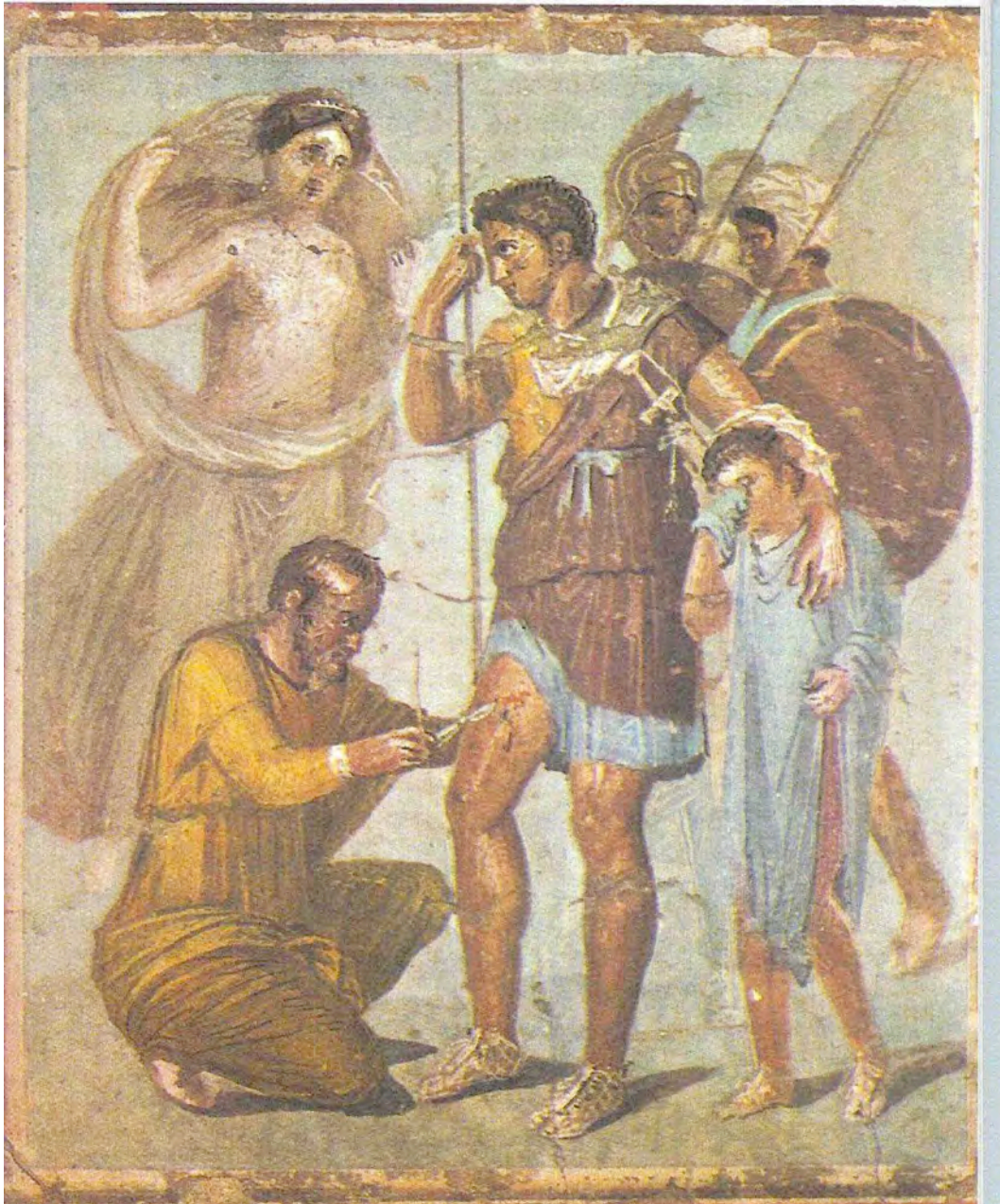
Enea in fuga da Troia viene curato da un medico (Pompei, affresco I° secolo D.C., conservato al Museo Archeologico di Napoli)