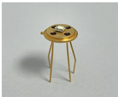
(Sensore realizzato con il materiale sensibile depositato tramite tecnica serigrafica sul substrato di allumina)