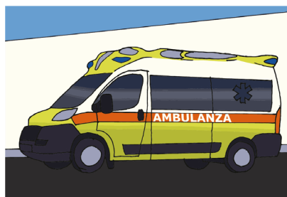
Fig.8 - Andiamo in ambulanza al Pronto Soccorso