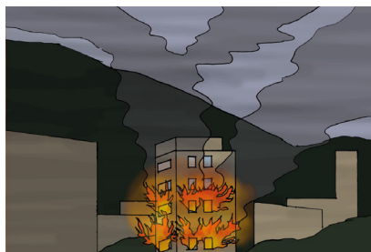
Fig.1 - C'è un incendio nell'edificio

Quelli che seguono sono solo alcuni semplici esempi con i quali può essere strutturata una breve comunicazione in emergenza. La pronta disponibilità di queste immagini può rappresentare una risorsa strategica nella gestione di una situazione critica.