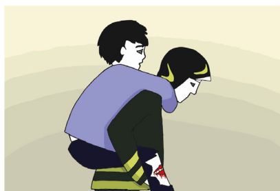
Fig.7 - Ti devo trasportare