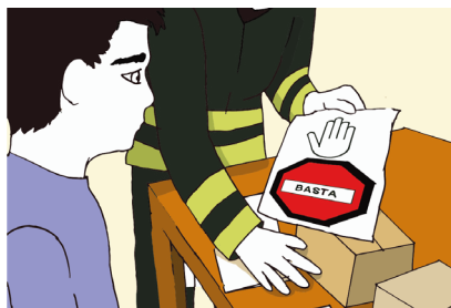
Fig.5 - Interrompi quello che stai facendo