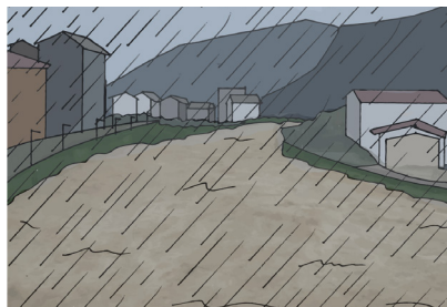
Fig.4 - Si sta verificando una alluvione