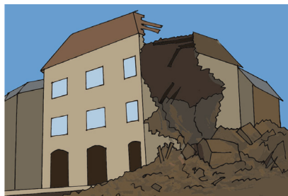
Fig.3 - C'è stato un terremoto