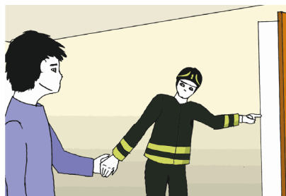
Fig.6 - Seguimi, andiamo fuori