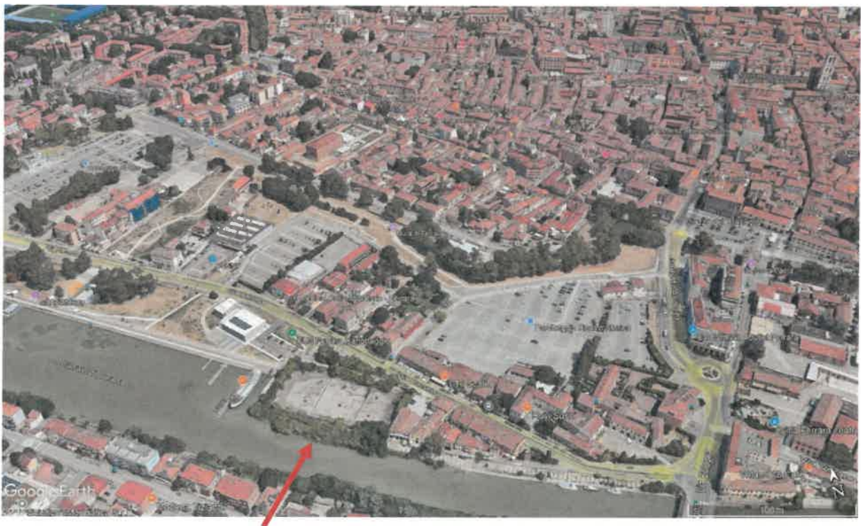
Vista aerea da sud con ripresa della Darsena verso il centro storico (vista Castello e Duomo in alto a destra)