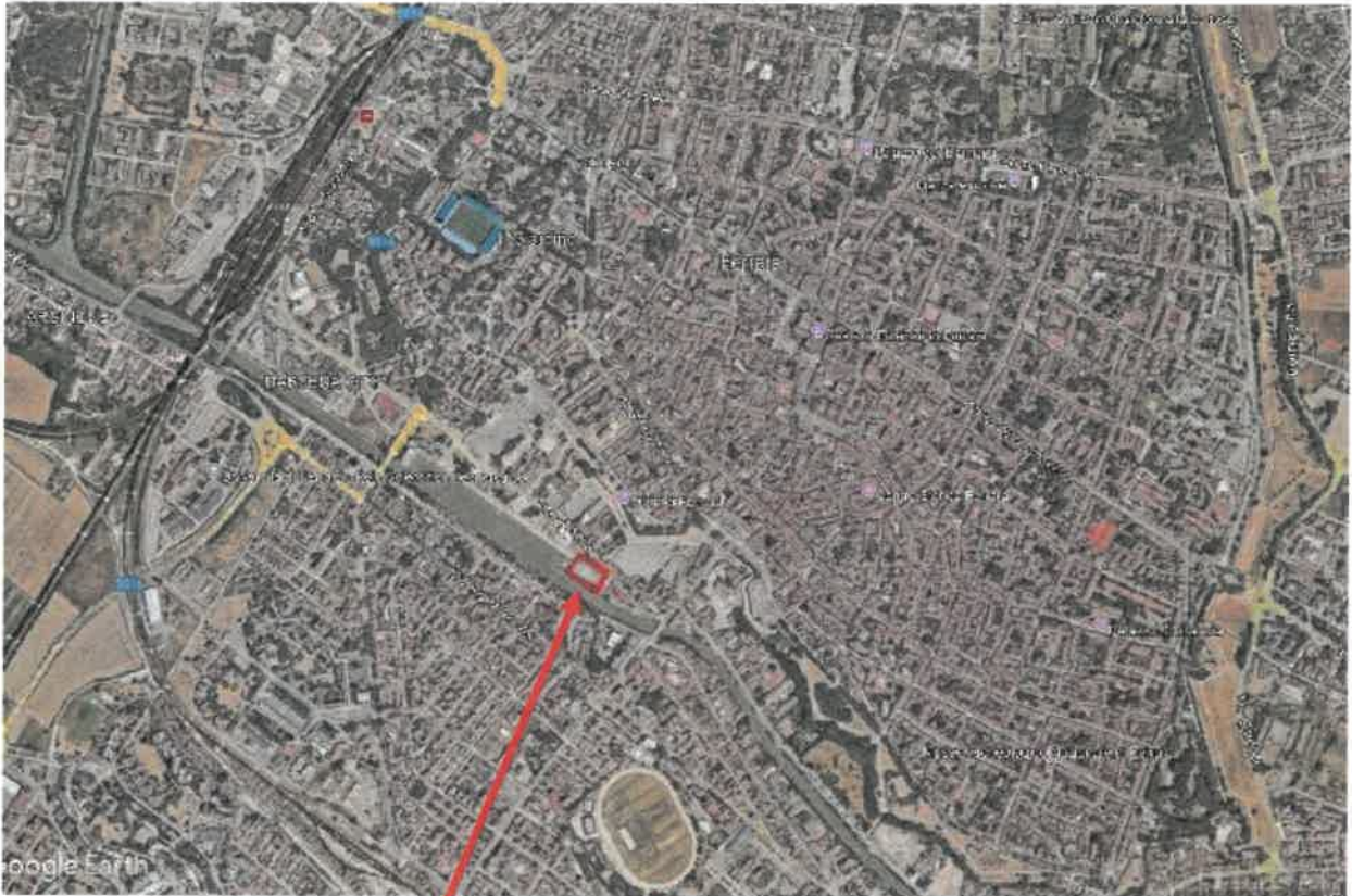
Individuazione area d'intervento