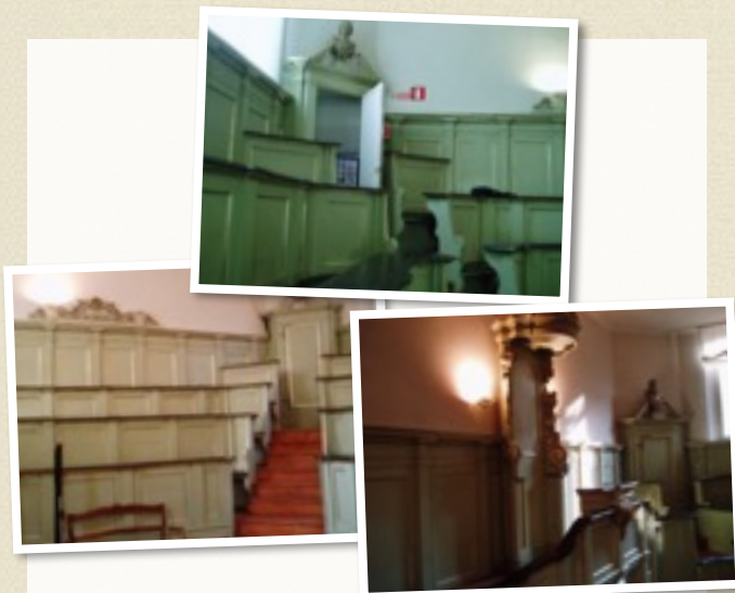
Immagini attuali del teatro Anatomico di Palazzo Paradiso

Cento anni di psicologia ferrarese, dalla scuola freniatria ferrarese fino ai giorni nostri, hanno disegnato una traiettoria varia e composita, con alterne vicende ma con una costante attenzione per la città ed i suoi grandi momenti scientifici, culturali, artistici. Nella rinnovata ed antica cornice del Teatro Anatomico si aprono dunque di nuovo, per il tredicesimo anno, le porte della Biblioteca Ariostea per proseguire con nuove tappe del percorso di un viaggio con la psicologia ed altre storie.