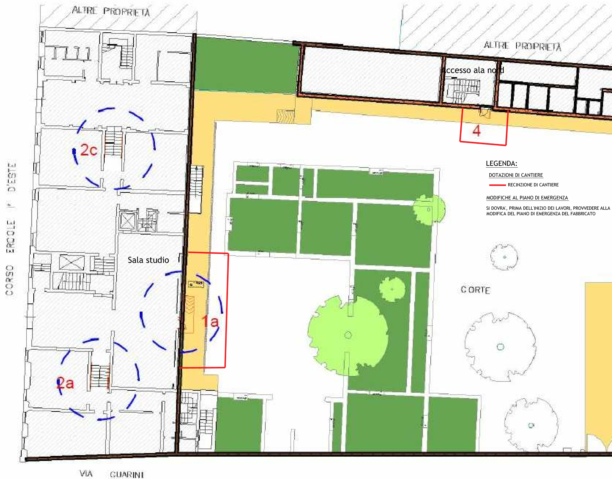
Organizzazione del cantiere Planimetria generale - FASE 1 - Zona corte interna- dal 08/01/2020 al 23/02/2020