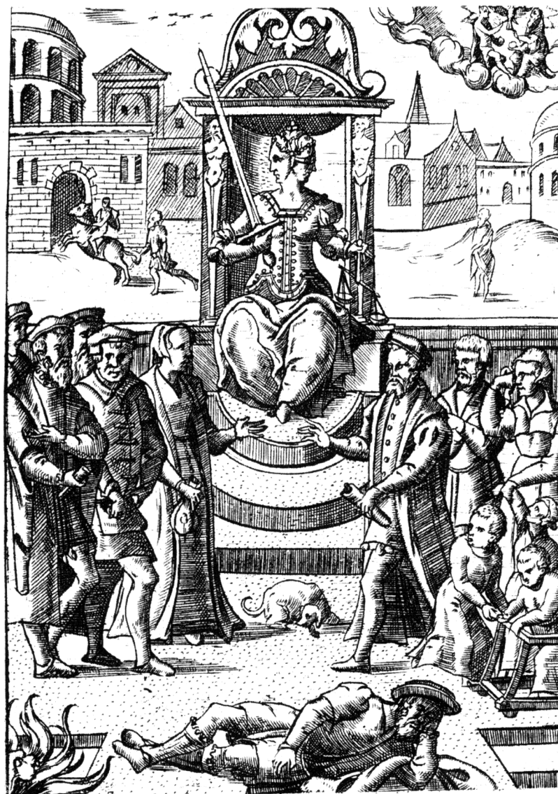
Figura 11 - La Giustizia bifronte 1554, Illustrazione della Praxis rerum criminalium di Joos Damhouder.