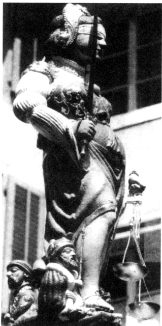
Figura 10 - La Giustizia calpesta i potenti 1561, L. Perroud. Soleure, Fontana di Giustizia.