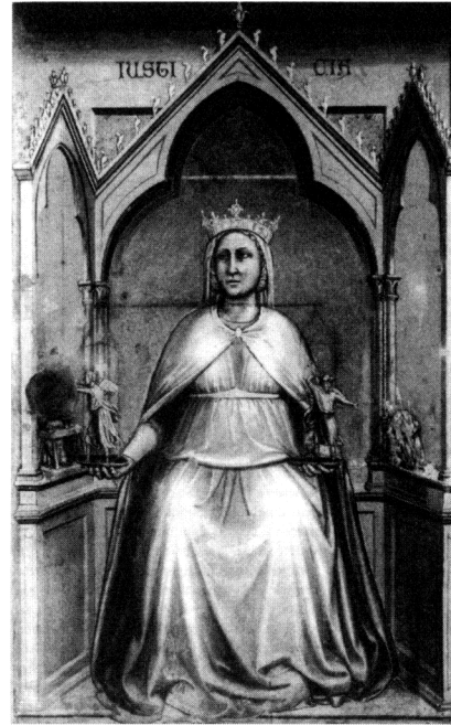
Figura 4 - La Giustizia 1305, Giotto. Padova, Cappella degli Scrovegni.