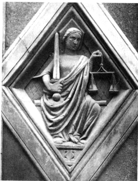
Figura 6 - La Giustizia 1334, Andrea Pisano (e Giotto?). Firenze, Campanile di Giotto.