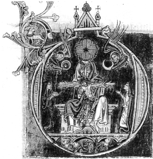
Figura 2 - Trono di Grazia Sec. XIII, Cambridge, Salterio del Trinity College.