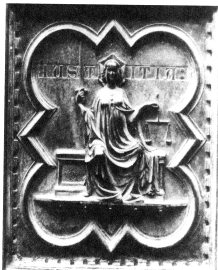
Figura 7 - Iustitia 1336, Andrea Pisano. Firenze, Porta sud del Battistero di San Giovanni.