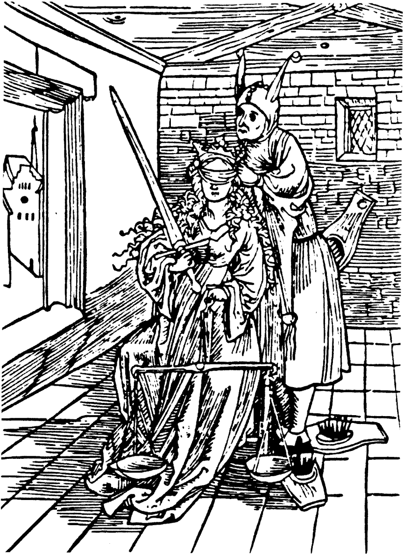
Figura 1 - Il folle benda la Giustizia 1494, Sebastian Brant, Das Narrenschiff .