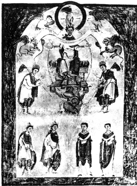
Figura 3 - Il Cielo, Ottone II, la Terra 973, Scuola renana. Aquisgrana, Evangelario .