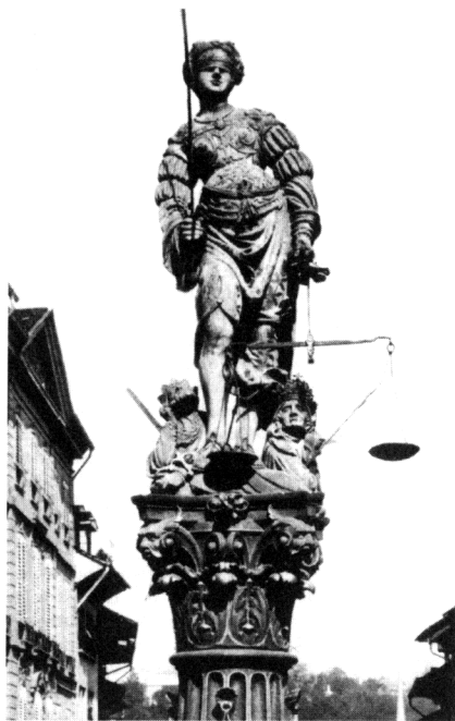
Figura 9 - La Giustizia con i potenti ai suoi piedi 1543, H. Gieng. Berna, Fontana di Giustizia.