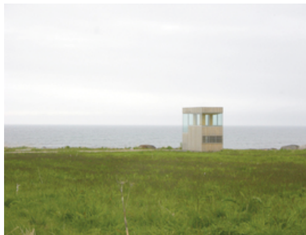
Torvdalsbalsen, 70° N arkitektur, Lofoten Islands, Norway