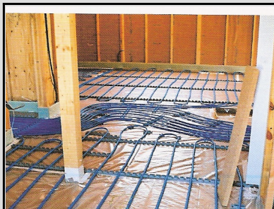
Impianto di riscaldamento a pavimento in un cantiere di una costruzione in legno con sistema costruttivo tipo "platform".

E' l'unità tecnologica costituita dall'insieme degli elementi tecnici del sistema edilizio aventi FUNZIONE DI CREARE E MANTENERE NEGLI SPAZI INTERNI del sistema edilizio stesso DETERMINATE CONDIZIONI TERMICHE, DI UMIDITA' e DI VENTILAZIONE.