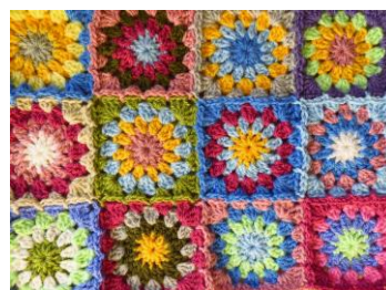
Esempio di Granny Style

Quadrati 13x13 cm in granny style realizzati dalle case di riposo Dimensioni: H 196 cm, larghezza 150 cm, profondità 5 m