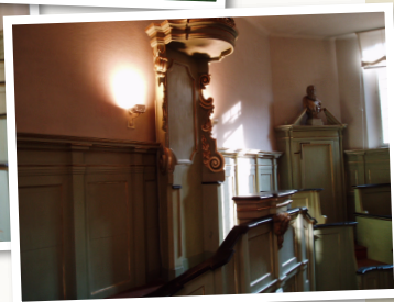
Immagini attuali del teatro Anatomico di Palazzo Paradiso

Nel trasferimento dalla sede originaria delle Crocette di San Domenico al Palazzo Paradiso (1567) si rese necessaria la costruzione di un primo teatro anatomico, dedicato alle dissezioni a scopo didattico frequentate dagli studenti, che contribuirono alle spese per la sua costruzione rinunciando, come risulta dalle cronache, ai soldi destinati alle feste carnevalesche. Fu soltanto nel 1731, grazie all'Anatomico Giacinto Agnelli e all'Architetto Francesco Mazzei, che fu approntato il Teatro Anatomico esistente, a pianta ottagonale, con entrate separate per gli studenti, il docente ed il cadavere, illuminato da quattro grandi finestre. Per circa un secolo il teatro Anatomico svolse la sua funzione originaria, fino al 1831 quando la sede della Facoltà di Medicina fu trasportata presso l'Arcispedale S. Anna di Corso della Giovecca.